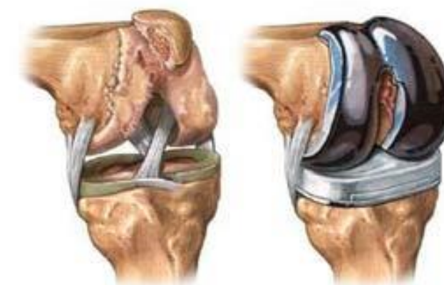
قبل از تعویض مفصل